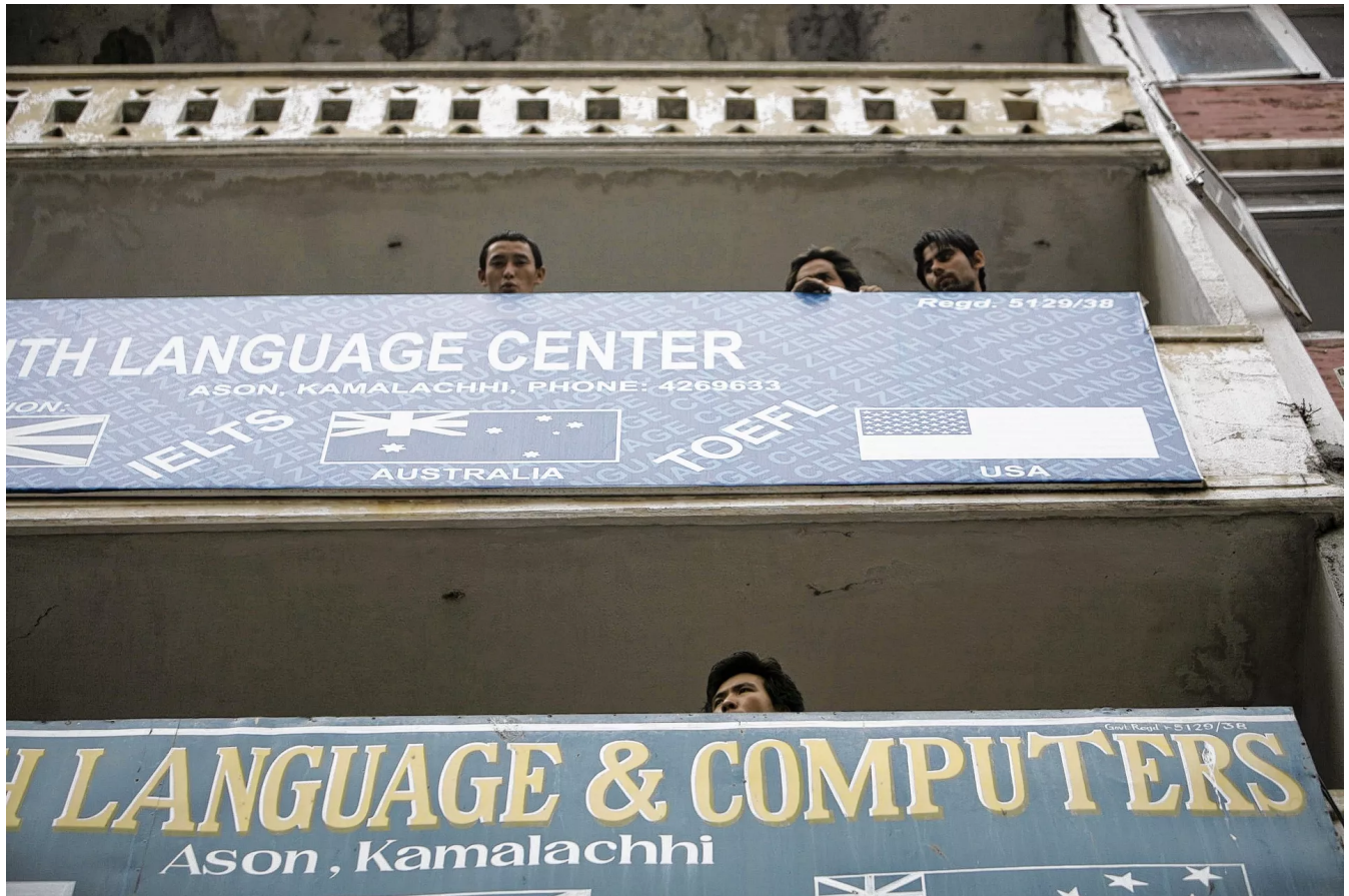
Nepalese studenten in Kathmandu, Nepal. Plieger-directeur Koert Huisman over de coronacrisis in het land: „Afgestudeerde studenten vonden nauwelijks nog banen.”

Flóri Hofman 17 februari 2021 om 21:12 Leestijd 3 minuten